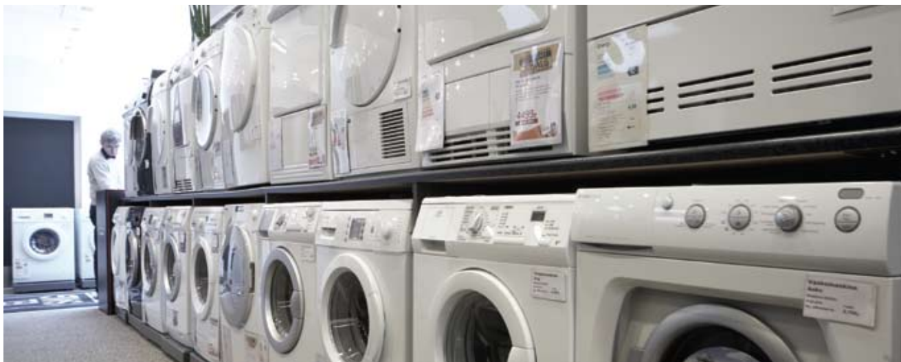
Viby El-værks butik - stort udvalg i hårde hvidevarer.

tilbagegang i både butiks- og grossistsomsætningen i 2008. Grossistsomsætningens tilbagegang blev yderligere forstærket gennem hele 2009 på baggrund af forretningsophør hos to af vores største detailkunder.