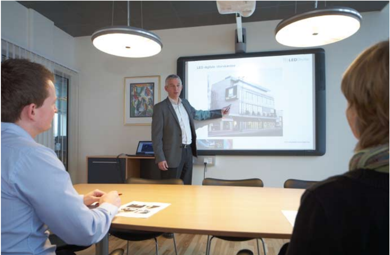
Efter ombygningen er der nu etableret tidssvarende mødefaciliteter med det nødvendige AV-udstyr.