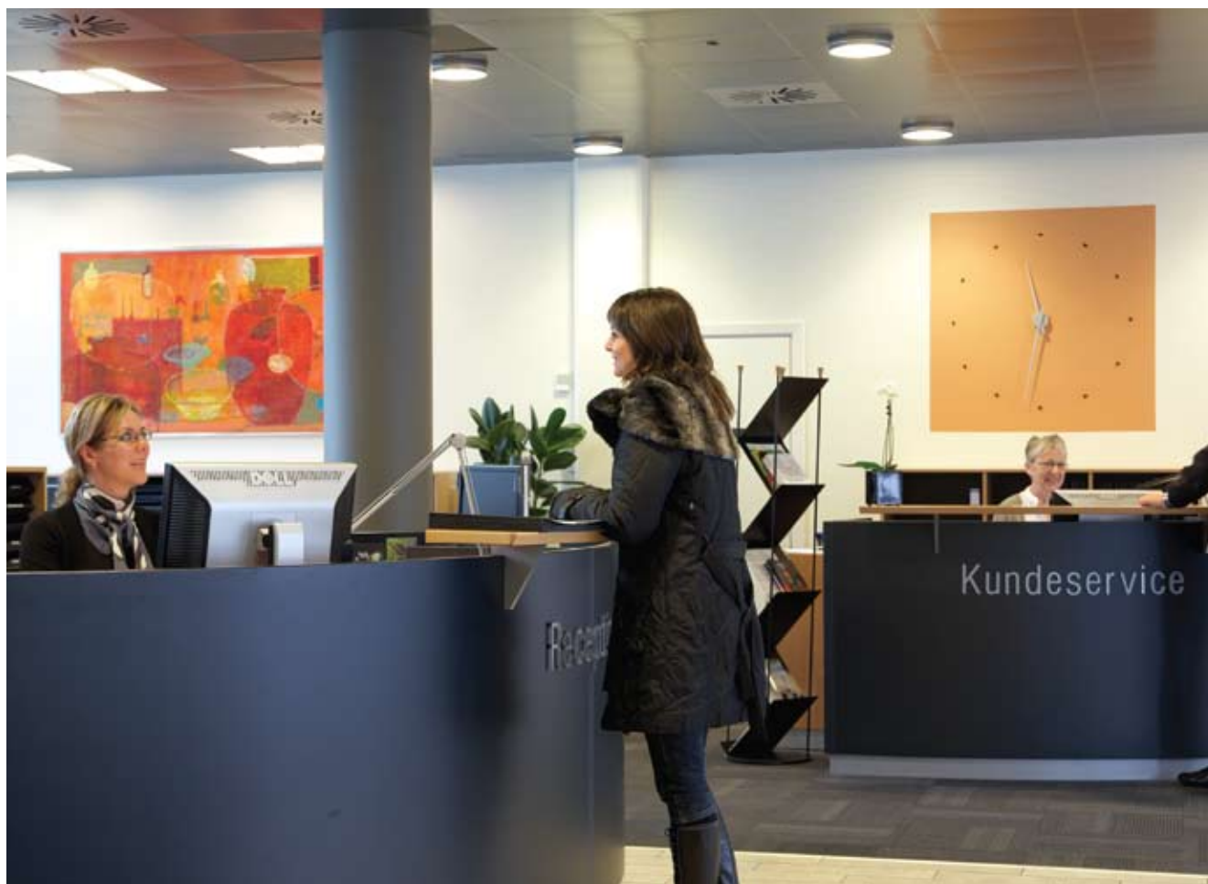
Viby El-værk byder kunderne velkommen i den nyindrettede reception.

Der er i regnskabsåret 2009 distribueret 109.919 MWh mod 110.169 MWh i 2008. Med et salg på 106.449 MWh har tabet i ledningsnettet været på 3,16 %. Tabsprocenten i de seneste fire år har i gennemsnit været på 2,64 %.