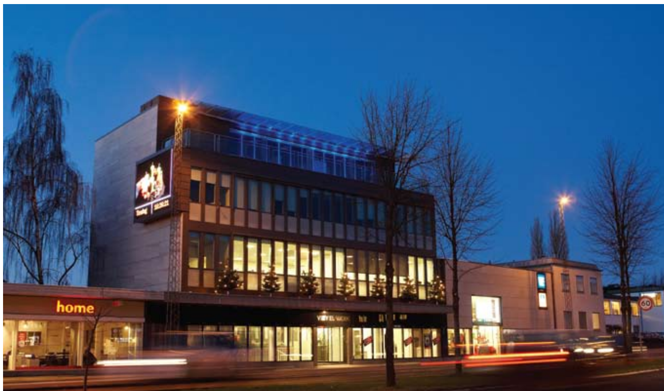
Skanderborgvej 180 - by night.