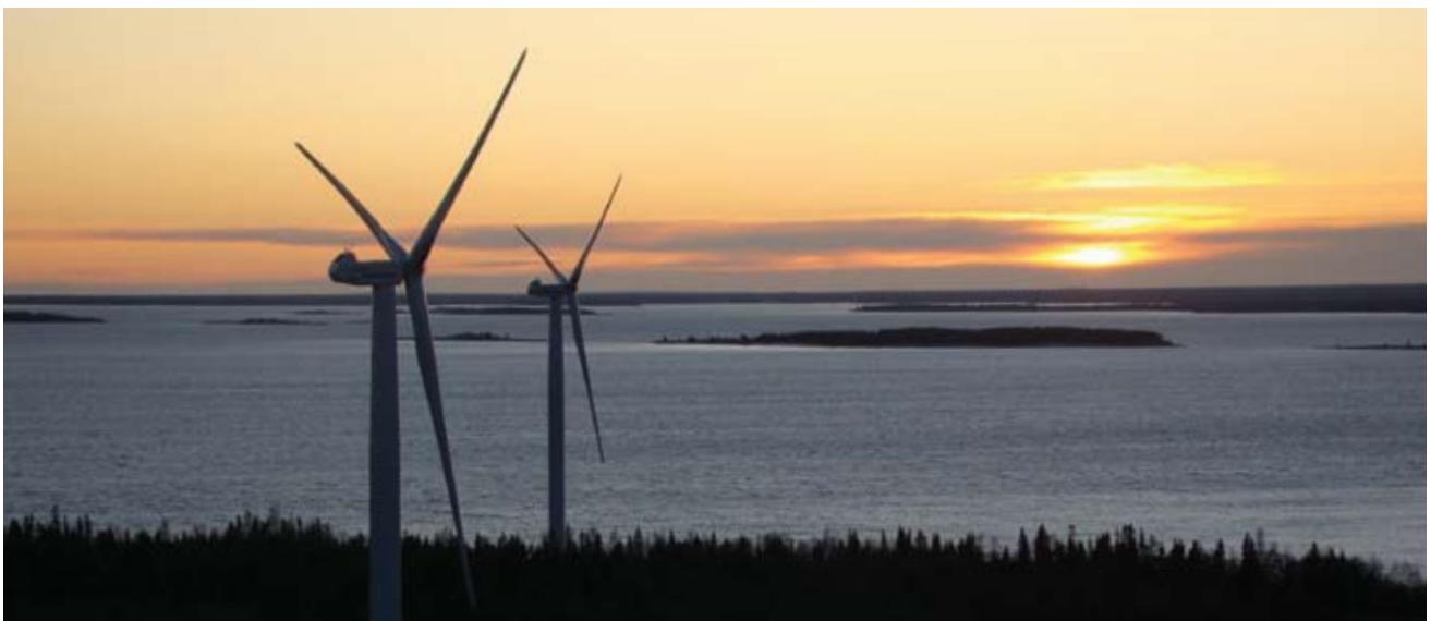
Viby Vind Bondön.

I 2010 forventer selskabet også et mindre underskud. Generelt er der dog forventning om, at LED-teknologien er på vej til at vinde større indpas i virksomhedernes markedsføringstiltag, hvorfor den digitale skiltning formentlig vil opleve en væsentlig større udbredelse i de kommende år.